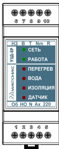
Рисунок 1 - Внешний вид устройства.

Изделие выполнено в диэлектрическом пластмассовом корпусе, его внешний вид показан на рисунке 1. Габариты и установочные размеры корпуса соответствуют стандарту DIN 43880, раздел 1. На верхней поверхности корпуса размещены 6 светодиодных индикаторов. По бокам корпуса расположены 10 винтовых клеммных зажимов для подключения изделия. На нижней поверхности изделия размещена защёлка для крепления на стандартную DIN-рейку. Также возможен монтаж изделия на плоскость с помощью поставляемых по отдельному заказу элементов крепления. Обозначения основных выводов изделия приведены на передней панели. Нумерация выводов указана на корпусе. Назначение выводов изделия приведено в таблице 2.